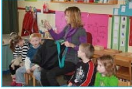
Groep 2: Een spannende tas met spellen. Alle voorwerpen die in de tas zitten, beginnen met de letter t.