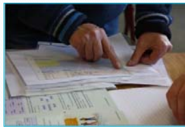
Groep 8: persoonlijk budget.