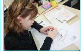
Groep 5: thema natuur