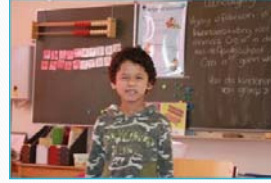
Groep 3: thema piraten