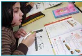
Groep 5: thema natuur.