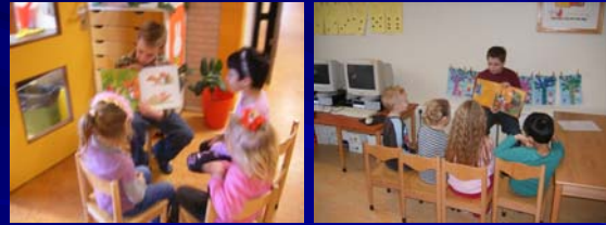
Er wordt voorgelezen aan groep 1 en 2

Tutor-lezen Op twee vaste middagen wordt er tutor gelezen. In de groep 1 en 2 is dit voorlezen uit prentenboeken.